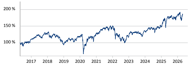
DWS ESG Investa LD