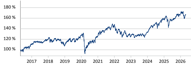
— RWS-DYNAMIK A