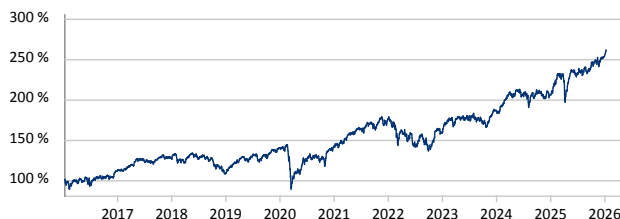
— DWS Qi Eurozone Equity RC