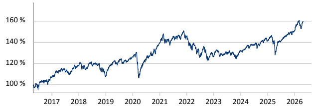
— Fürst Fugger Privatbank Wachstum