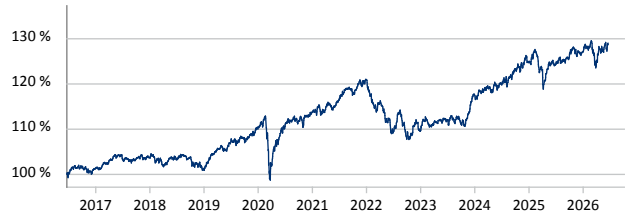
— ODDO BHF Polaris Moderate DRW-EUR