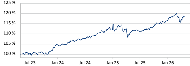
NÜRNBERGER Multi Asset Defensive