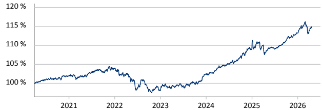
— NÜRNBERGER Multi Asset Protect