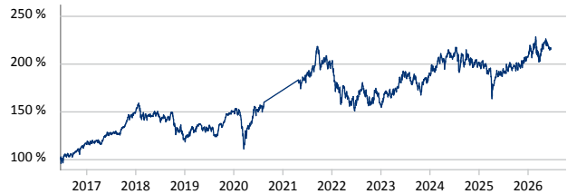
GAM Star Japan Leaders Ordinary JPY Acc