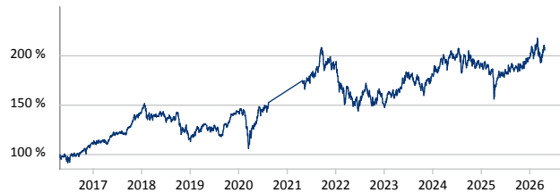
GAM Star Japan Leaders Ordinary JPY Acc