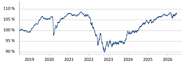
iShares € Corp Bond ESG SRI UCITS ETF EUR Dist