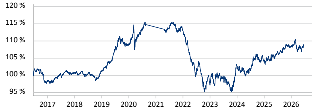
BlackRock Global Funds - Global Government Bond Fund A2 USD