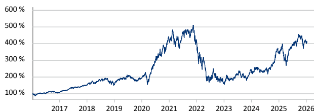
Morgan Stanley US Growth Fund A USD