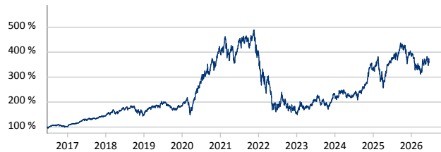
Morgan Stanley US Growth Fund A USD