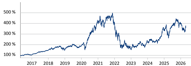
Morgan Stanley US Growth Fund A USD