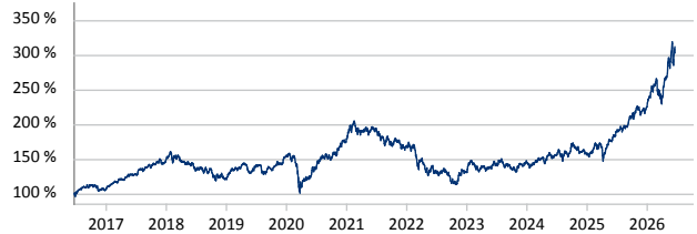
Templeton Emerging Markets Fund A (acc) USD