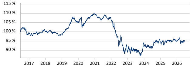
— Allianz Euro Bond - A - EUR