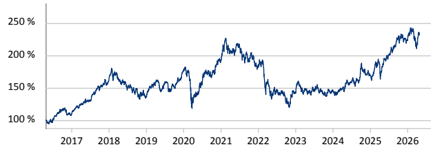
Templeton BRIC Fund A (acc) USD