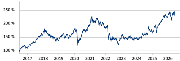
— Templeton BRIC Fund A (acc) USD