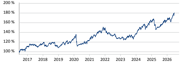
— DWS Garant 80 FPI