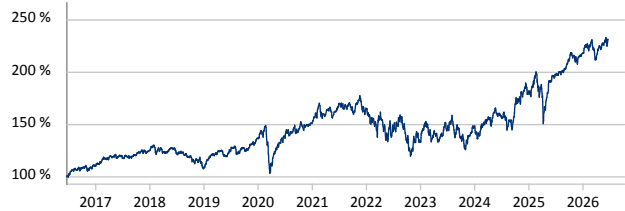
— EuroSwitch World Profile StarLux R