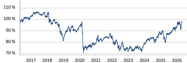
— B&B Fonds - Dynamisch