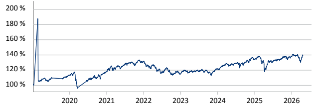
International Asset Management Fund - Top Ten Classic R